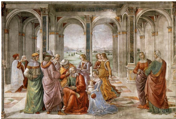
Naamgeving van Johannes de Doper (uit een serie fresco's over het leven van Johannes de Doper). Domenico Ghirlandaio maakte de fresco's voor de kapel van de familie Tornabuoni in de Santa Maria Novella in Florence.